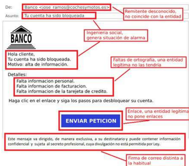
Ilustración 1. Ejemplo de correo electrónico fraudulento

Los correos electrónicos fraudulentos suelen contar con varias características que permiten su detección. A continuación, por medio del siguiente ejemplo se analiza un ejemplo de correo electrónico fraudulento.